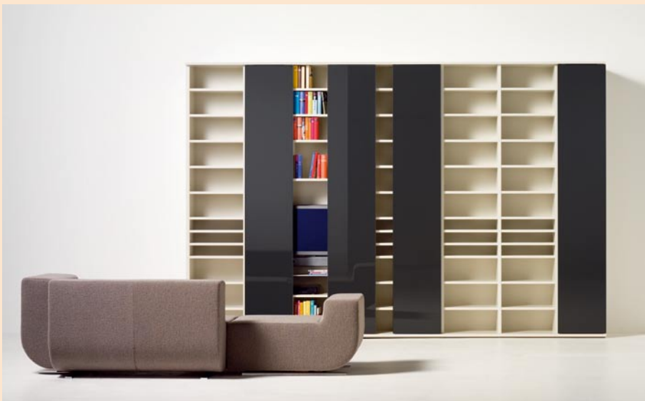
studimo 06 von Interlübke