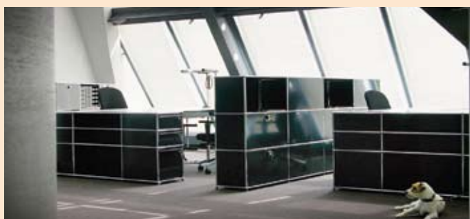
Mehr Fotos finden Sie unter „Aktuelles“ auf unserer Internetseite www.bueroforum.net