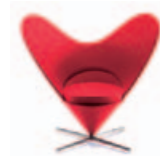
Heart-Shaped Cone Chair Miniatur 191,-