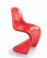
Panton Miniatur 5er Set 115,-