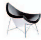
Coconut Chair Miniatur 189,-