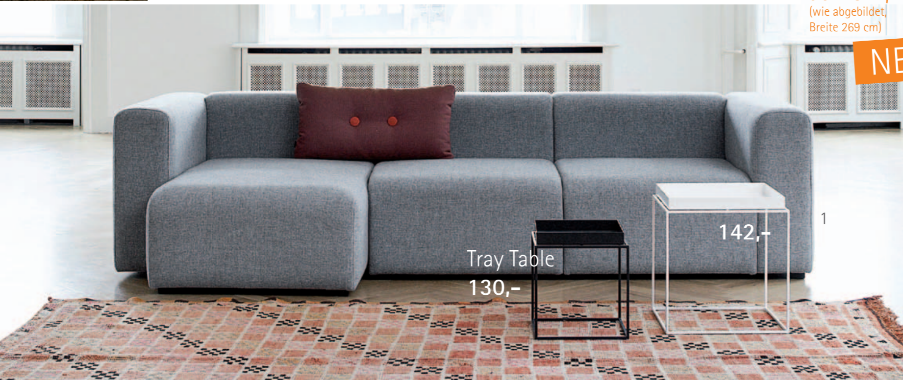
Sofa Mags ab 2.512,- (wie abgebildet, Breite 269 cm)