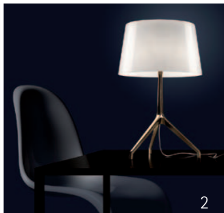
2 LUMIERE XXL von Foscarini Lumiere XXL verleiht dem Raum einen Touch von Klassik und Eleganz. Die zeitlos schöne Tischleuchte steht auf einem markanten Dreifuß aus lackiertem Aluminium in weiß oder bronze. Der Schirm besteht aus hochwertigem mundgeblasenem Glas in schwarz oder weiß. 37 x 57 cm 595,- Euro