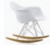
Eames Chair RAR Miniatur 113,-