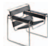
Wassily Miniatur 176,-